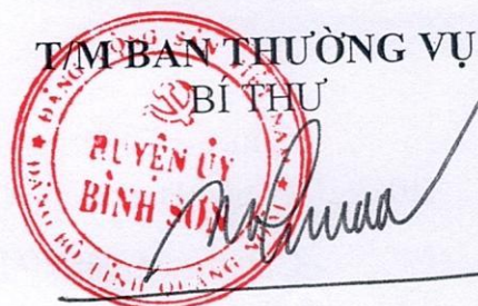
Võ Văn Đồng